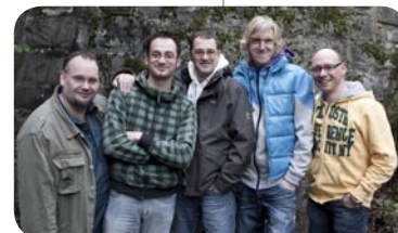
Wir coachen euch gerne und mit Leidenschaft. Eure Wiedenester Jugendreferenten